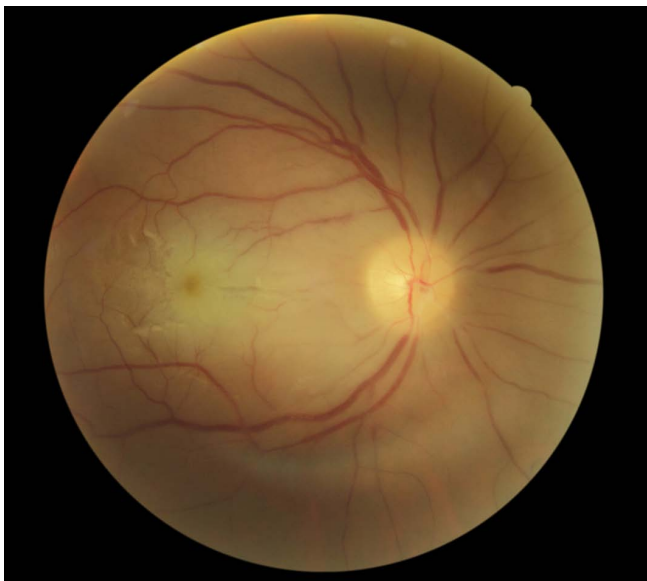
Рис. 3. Через 10 дней после окклюзии центральной артерии сетчатки на фоне терапии