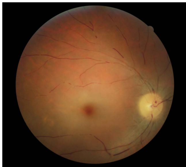
Рис. 2. Окклюзия центральной артерии сетчатки после косметологического воздействия в периорбитальной зоне